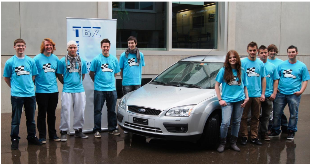
Abbildung 1: Die Absolvent/-innen der Car Academy.

Über Jahre befasste sich die Förderpädagogik vor allem mit Lernenden, welche schulische Defizite aufwiesen. Mit viel Aufwand wurden Zusatzangebote für die Gruppe von Lernenden entwickelt und angeboten. Leider gingen dabei die Lernenden auf der anderen Seite der Gaussschen Verteilung vergessen. Das Lehrerteam der Abteilung Automobiltechnik hat diesen Misstand erkannt und ein spezielles Programm für die Lernenden entwickelt, welche nebst den schulischen Leistungen auch die nötige Motivation mit sich bringen um an zusätzlichen schulischen Inhalten interessiert zu sein.