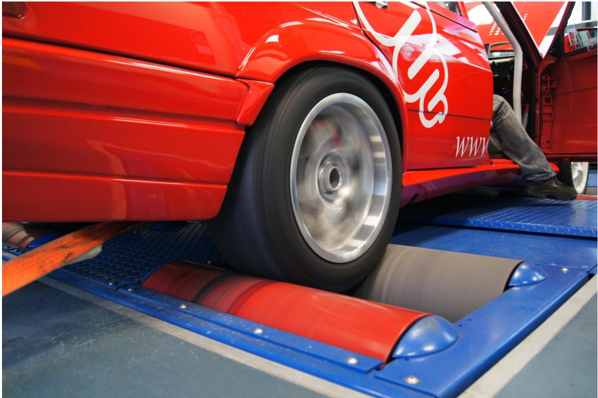
Abbildung 2: Leistungsmessung auf dem Prüfstand.

Programm ist jeweils auf den aktuellen Lehrplan abgestimmt und vertieft die dort vermittelten Inhalte. Folgende Bereiche werden über 6 Semester vermittelt: Physik am Fahrzeug, elektrische und elektronische Schaltungen, Tuning, Kraftübertragung, Messgeräte und Diagnose.